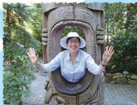
東京都市大学特別教授 (一社)生物多様性アカデミー代表理事